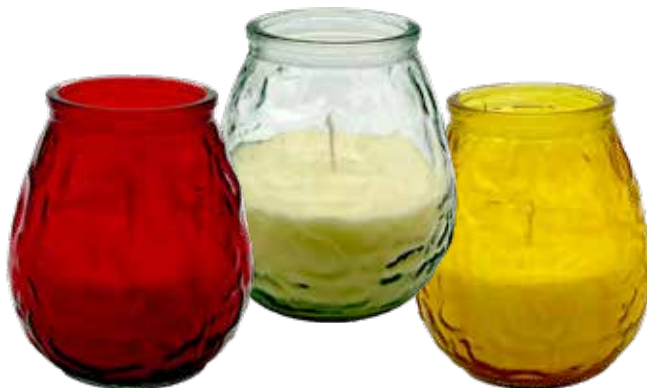
AMBER ART. 72684