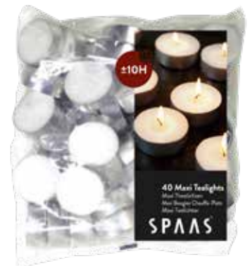
SPAAS THEELICHTJES MAXI 10H 40ST ART. 43271