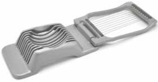
HENDI EIERSNIJDER RECHTHOEKIG ALUMINIUM 130X85MM ART. 4870 VAN 9,50 NU 7,32